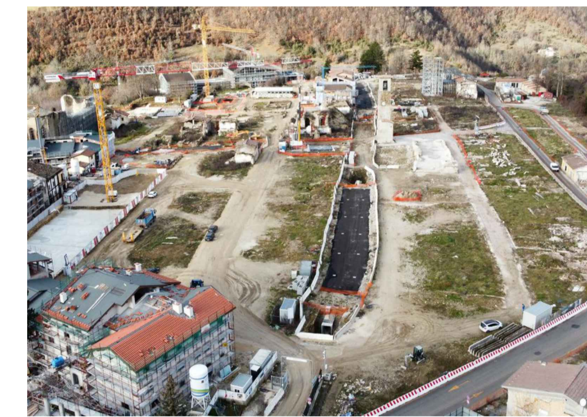
Vista Cantiere del 19/12/2024