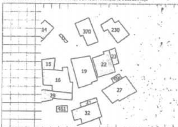
MAPPA DELL'AGGREGATO STRUTTURALE CON IDENTIFICAZIONE DELL'EDIFICIO